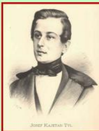
JOSEF KAJETÁN TYL